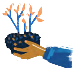
Abbildung 3.2.2: In einer Solidarischen Landwirtschaft (SoLaWi) sorgt die Gemeinschaft für eine bunte Ernte für alle

die Gemeinschaft langfristig und im Voraus alles, was sie für die agrarökologische Lebensmittelherzeugung braucht – also zum Beispiel Saatgut, Land und Maschinen, aber auch den Lohn von Gärtner*innen. Neben den angestellten Gärtner*innen sind alle anderen Mitglieder ebenso dazu eingeladen oder auch angehalten beim Jäten, bei der Ernte und bei der Verteilung zu helfen. Entsprechend der eigenen Kapazitäten können so alle zur gemeinsamen Nahrungsmittelherstellung beitragen. Der Hof wird zu einem erfahrbaren Raum, Wissen und Fertigkeiten werden geteilt. Die Mitglieder übernehmen im Idealfall gemeinschaftlich und langfristig Verantwortung und begegnen sich auf Augenhöhe. Entscheidungen treffen sie basisdemokratisch. Sie erhalten dafür wöchentlich den gleichen Ernteanteil – egal, wie groß dieser ausfällt. So lassen sie die Gärtner*innen nicht mit dem Risiko einer schlechten Ernte allein. 3