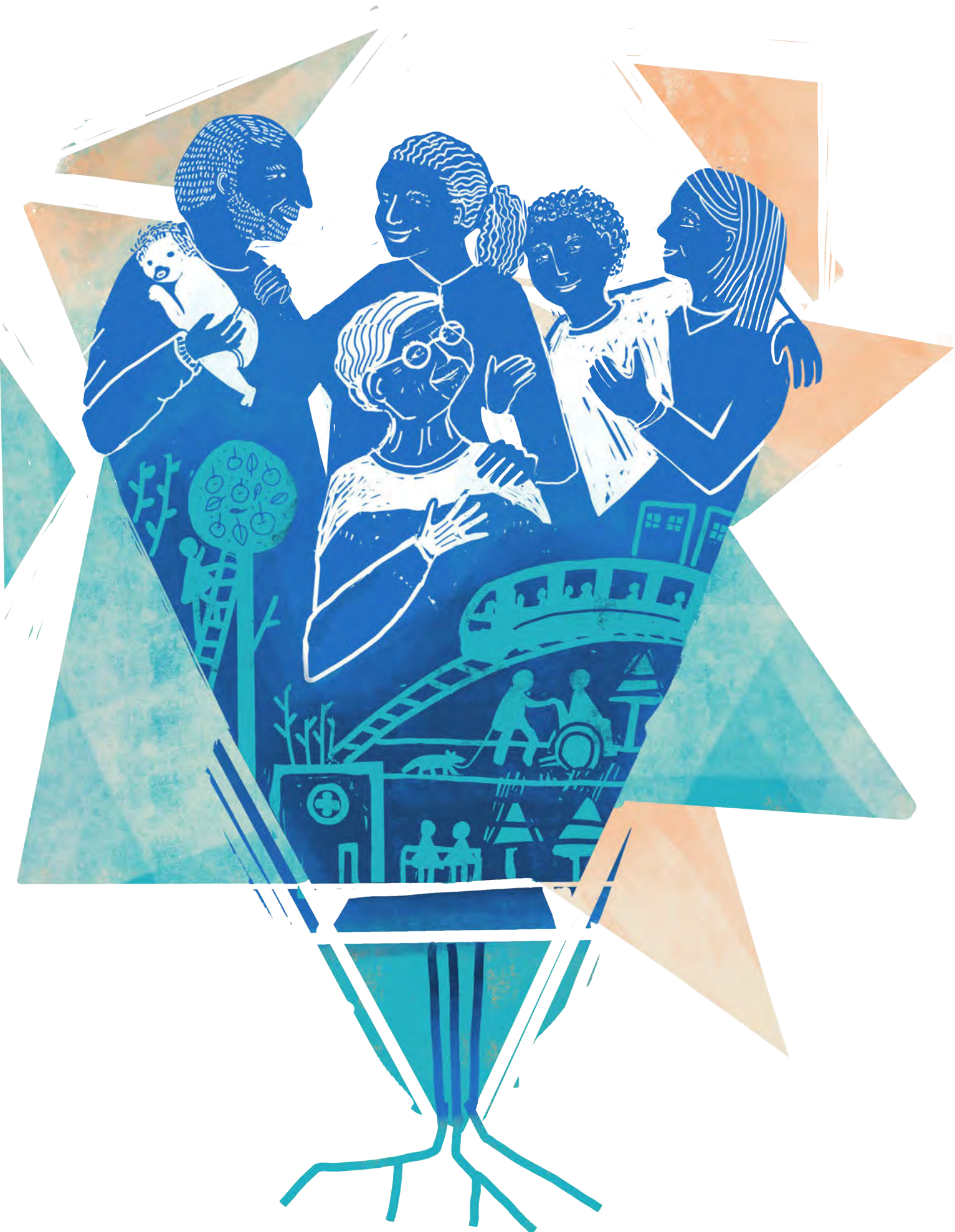
Abbildung 3.1.1: Sorgetätigkeiten umfassen alles Leben, menschliches und nicht-menschliches.