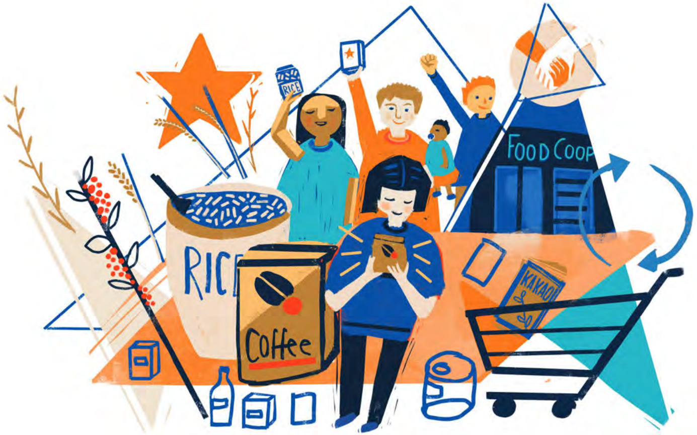
Abbildung 3.2.3: In einer FoodCoop entscheiden die Mitglieder gemeinschaftlich, was wie und von wo auf ihren Tellern landet

gängigen niedrigen Gemüsepreise ist den Mitgliedern ein angemessener Beitrag nur schwer zu vermitteln. Die SoLaWis diskutieren außerdem, wie weniger ressourcenintensive Technologien und Maschinen eingesetzt werden können. Machtvolle Akteur*innen im Agrarsektor erschweren es den Gemeinschaften auch, an bezahlbares Land zu gelangen. Vor diesem Hintergrund versuchen einige Initiativen, wie die Kulturland eG , Land in genossenschaftlich (siehe GLOSSAR) organisierten Gemeinschaftsbesitz umzuwandeln.