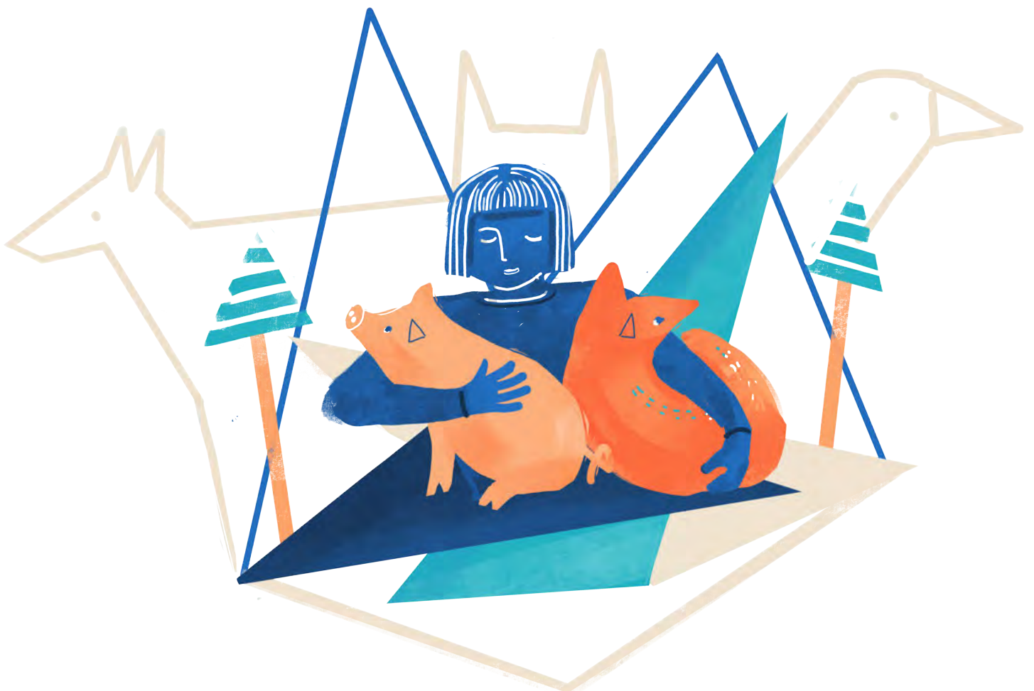
Abbildung 3.1.2: In der solidarischen Lebensweise hat der Mensch einen anderen Umgang mit seiner Mitwelt.

und lebensspendenden Logik gesellschaftlicher Sorge (siehe Abbildung 3.1.2). Der deutsche Arzt Rudolf Virchow verwies schon Mitte des 19. Jahrhunderts darauf, dass eine kluge Sozialpolitik die beste Medizin gegen die meisten Krankheiten darstellt. 16 Sorge und ihre gesellschaftliche Umsetzung und Verhandlung ist Politik (siehe INSTITUTIONEN). Denn nur eine solidarisch sorgende Politik schafft Sorgeverhältnisse, die ein Gutes Leben für Alle ermöglichen.